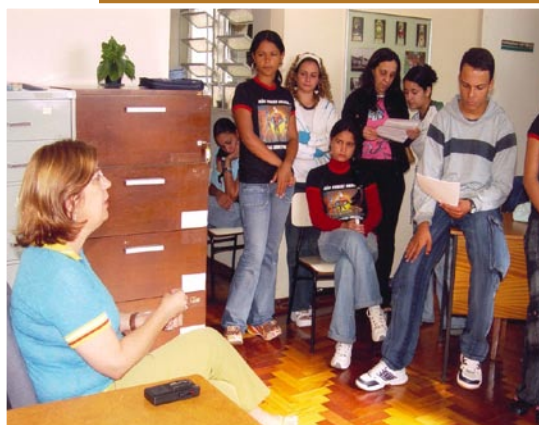
Bate-papo durante visita.