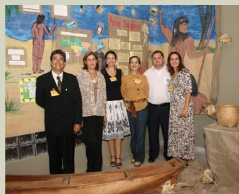
Representantes da Fundação Bradesco, da FIAT Automóveis e coordenadora do Projeto Tesouros do Brasil.