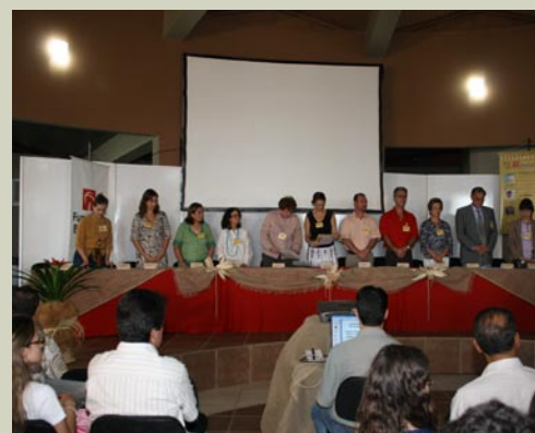
Palestrantes e convidados assistem à apresentação do Hino Nacional em Guarani.

Os Guarani-Mbyá constituem a maioria da população indígena do litoral sul e sudeste do País. Em Santa Catarina, perto de Laguna, há duas aldeias. Os índios da aldeia conseguem recursos para a sua subsistência através da venda de artesanato e o maior problema enfrentado para conseguirem manter seus costumes e cultura, segundo constatação dos alunos da Fundação Bradesco, é a demarcação de terras. Pretendem divulgar esta luta para a comunidade e outras escolas através das peças de teatro, entrega de panfletos e cartões postais.